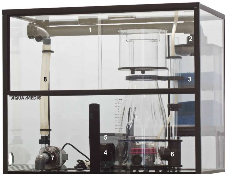
Schéma 1: Reef Station

Dimensions: ~ 75,5 x 47,5 x 62 cm (L x l x h).