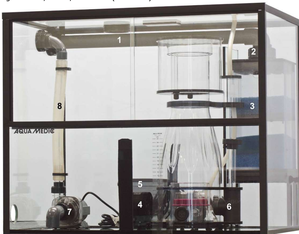
Abb. 1: Reef Station

Abmessungen: ~ 75,5 x 47,5 x 62 cm (L x B x H).