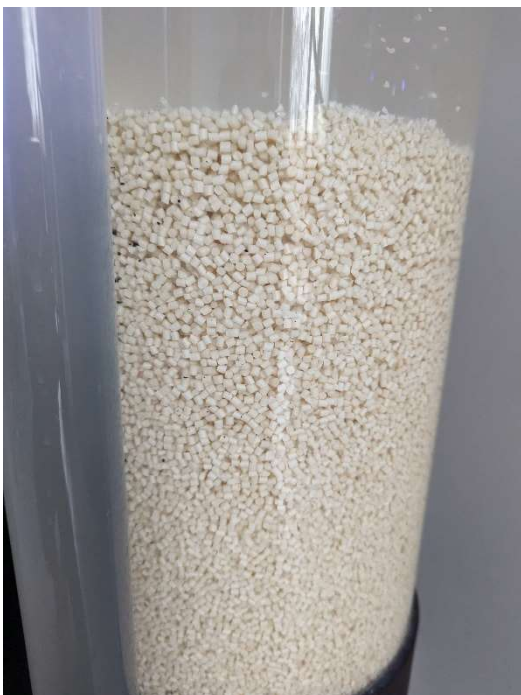
Fig. 2: Filtro de pellets lleno en funcionamiento. Los gránulos sólo se revuelven ligeramente.

Verter agua sobre la cantidad necesaria de pellets, recomendamos Aqua Medic NP biograin (máx. 8 litros) y remover varias veces. Las burbujas de aire se acumulan en los gránulos y hacen que floten. Cuando ya no queden pellets colgando en la superficie ni se formen aglomeraciones de pellets con burbujas de aire, se pueden añadir al filtro. Recomendamos dejar los gránulos en un cubo de agua durante 1 ó 2 horas y agitarlos enérgicamente de vez en cuando. La cantidad de gránulos debe ajustarse al volumen del acuario. Si la cantidad es demasiado grande, existe el riesgo de que se produzcan condiciones anaeróbicas en el acuario: por lo tanto, mantenga la cantidad de gránulos baja al principio y añada más posteriormente si es necesario.