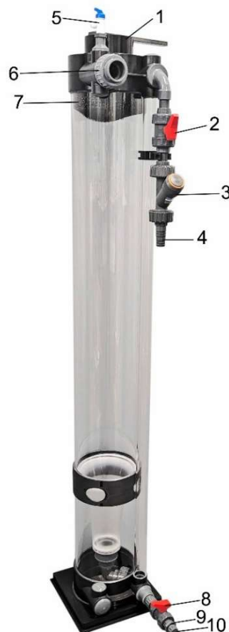
Fig. 1: Pellet Filter Pro