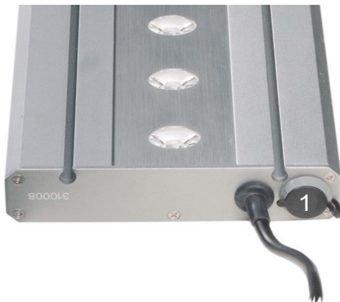
Fig. 2: 1 = attacco per Ocean Light LED Control

Ocean Light LED Control puo'essere usato solo con l'attacco stabilito (fig. 2, No. 1) di un Ocean Light LED o ECOplant LED.