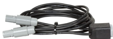
Рис. 1: Разветвительный кабель для Ocean Light LED

Дополнительно можно приобрести разветвительный кабель для подключения к контроллеру нескольких светильников Ocean Light LED.